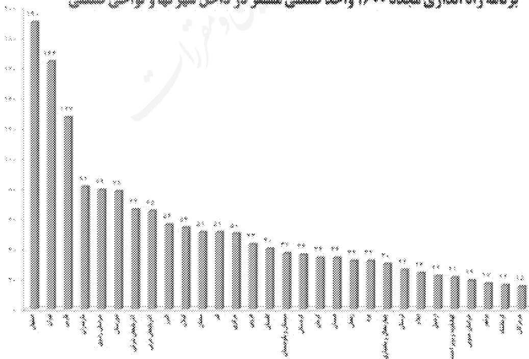
برنامه راه اندازی مجدد ۱۶۰۰ واحد صنعتی مستقر در داخل شهرکها و نواحی صنعتی

تبصره - به منظور اتخاذ تصمیم در خصوص واحدهای راکد و غیرفعال و بررسی و حل و فصل سایر مشکلات مربوط به شهرک ها و نواحی صنعتی و واحدهای مستقر در آنها، حسب درخواست شرکت شهرک های استان، کارگروه تسهیل و رفع موانع تولید در محل شهرک صنعتی مربوطه تشکیل می گردد.